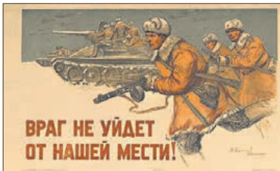
Враг не уйдет от нашей мести! Худ. В. Ефанов, К. Финогенов. 1943 г.