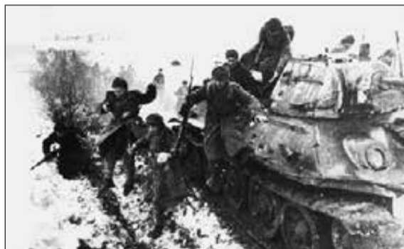
Танковый десант Ленинградского фронта под Кингисеппом. Январь 1944 г.

тельные рубежи. По дороге к этому городу начались тяжелые кровопролитные бои. Немецкое командование планировало удержать советские войска на дальних подступах к нему. Газета Ленинградского фронта «На страже Родины» сообщала, что их оборона была поручена двум немецким пехотным дивизиям — «Нордланд» и 61-й дивизии, «сколоченной из остатков разгромленных 61-й, 225-й, 227-й и 170-й пехотных дивизий, 9-й и 10-й авиационных дивизий и сводных отрядов береговой обороны». Однако натиск советских войск на пути к Кингисеппу был стремительным. 27 января командующий отступавшей немецкой группировкой писал в своем приказе: «Надо отдать должное русским в умении энергично преследовать».