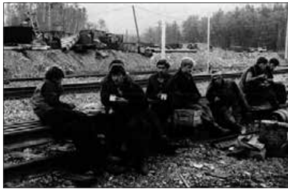
Студенты строят Юктали

ительства дороги ее в реке ловили много и возили возами. Ловят ее только на больших реках, потому что мелкие речки и ручьи промерзают до дна!