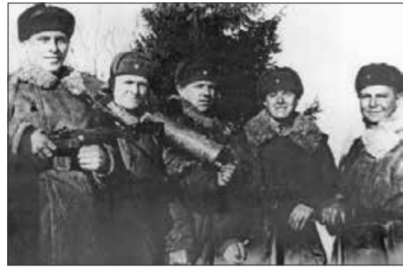
Группа бойцов под Нарвой. Февраль 1944 г.

янные атаки противника. Теперь здесь образовался единый фронт четырех советских дивизий, а удерживаемая ими территория расширилась до 10 километров в длину и нескольких в глубину.