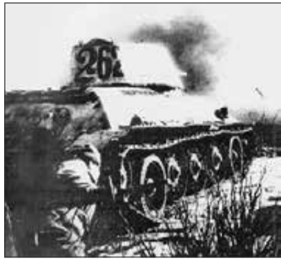
Фрагмент одной из атак советских войск на Нарвском фронте зимой 1944 года