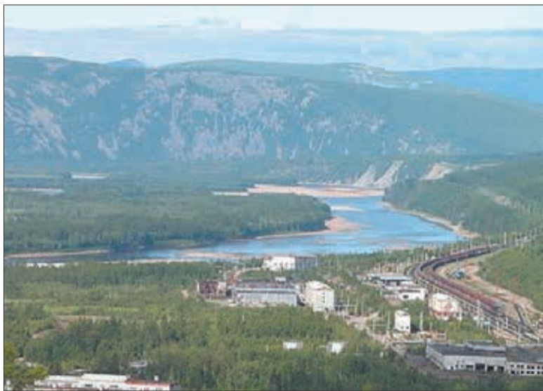
Вид на поселок Юктали с вертолета