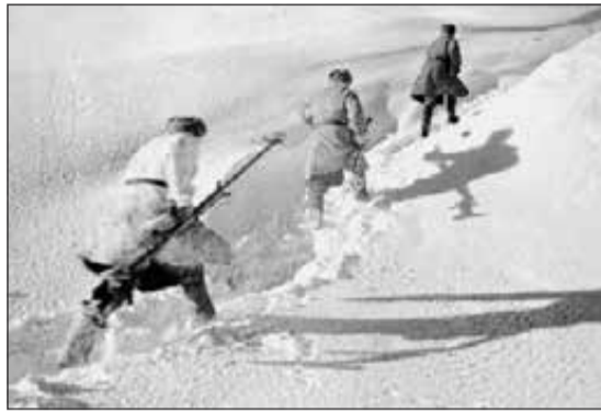
Советские пехотинцы в районе Нарвы. Зима 1944 г.