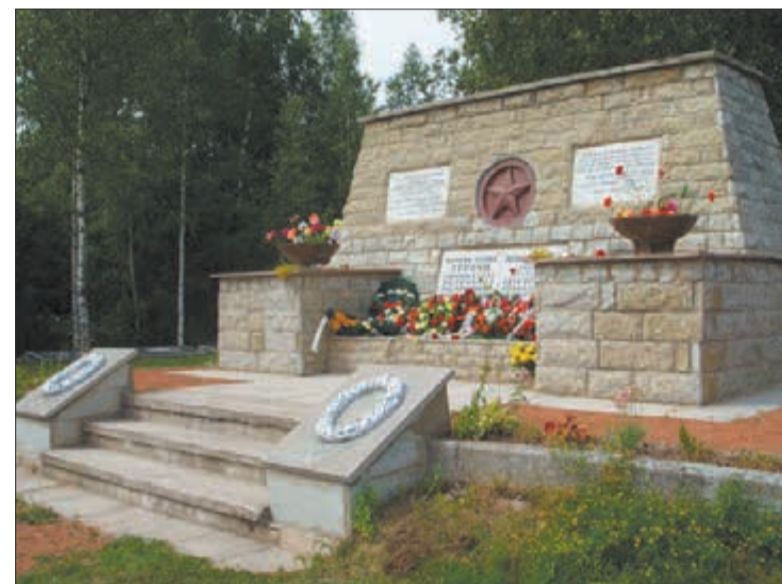
Одна из братских могил советских воинов, павших на высотах Синимяэ. Поселок Вайвара. 2010 г.