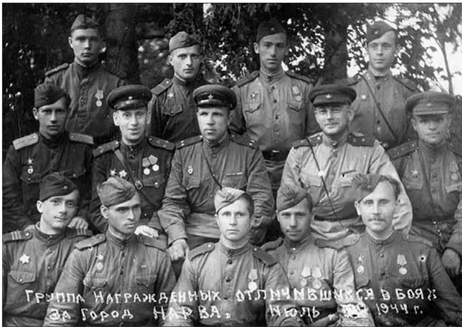
Группа солдат и офицеров, награжденных за отличие в боях за Нарву летом 1944 года

К сожалению, даже многие историки современной России не знают о долгой и кровавой битве под Нарвой. Это доказывает анализ юбилейных книг о Великой Отечественной войне, изданных к 70-летию Победы, а также выходящих сегодня — уже к 80-летию. В большинстве их о Нарве нет ни слова. В тех же книгах, где есть упоминание о здешних боях, все сводится к одной «Нарвской операции», которая длилась якобы лишь одну неделю — с 24-го по 30 июля — и имела единственной целью освобождение Ивангорода и Нарвы. Мало того, появились юбилейные издания, в которых утверждается, что все сражение за Нарву шло всего-навсего два дня — 25 и 26 июля! Таким образом, в новых книгах о войне не только отсутствует правдивая историческая информация о битве под Нарвой, но умалчивается героическая и жертвенная борьба войск Ленинградского фронта. А главное — вычеркиваются из истории и народной памяти десятки тысяч советских солдат, павших и получивших ранения в боях под этим городом в феврале — сентябре 1944 года. То есть за семь с половиной месяцев! Кроме того, следует помнить верное