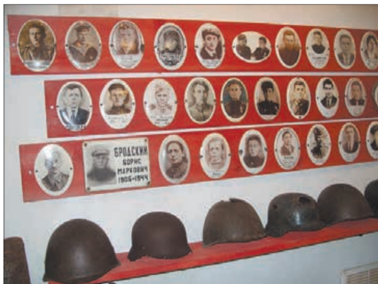
Фотографии некоторых советских бойцов, погибших на линии Танненберг. Музей Второй мировой войны в пос. Вайвара. 2010 г.